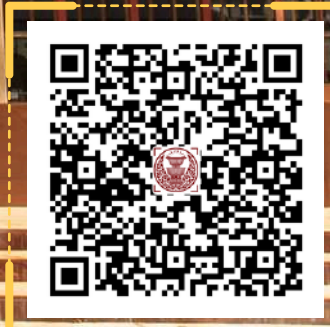
กิจกรรมส่งเสริม การปฏิบัติตามหลักศาสนา