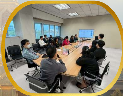
กิจกรรมขับเคลื่อน องค์กรคุณธรรมด้วยมิติวัฒนธรรม