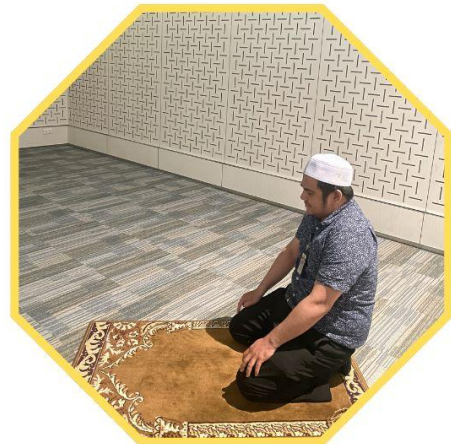
กิจกรรมทางศาสนาอิสลาม