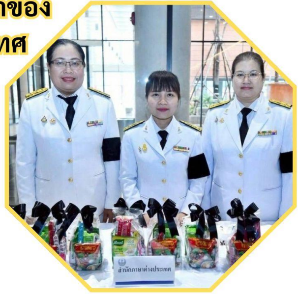
กิจกรรมทางศาสนาพุทธ