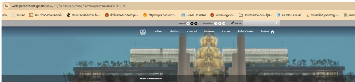
สำนักการคลังและงบประมาณ (สว) ประกาศเจตนารมณ์ร่วมกับในการยกระดับการขับเคลื่อนมาตรฐานองค์กรต้นแบบ ด้านคุณธรรม ความโปร่งใส การป้องกันการทุจริต สำนักสวัสดิการและทรัพยากรบุคคลและความสำเร็จขององค์กรอย่างยั่งยืน