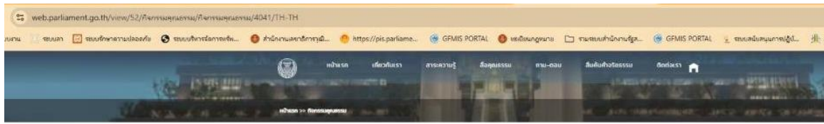
สำนักการคลังและงบประมาณ (สว) ประกาศเจตนารมณ์ร่วมกับในการยกระดับการขับเคลื่อนมาตรฐานองค์กรต้นแบบ ด้านคุณธรรม ความโปร่งใส การป้องกันการทุจริต สำนักสวัสดิการและทรัพยากรบุคคลและความสำเร็จขององค์กรอย่างยั่งยืน และนโยบายและการกระทำต่างๆ ประจำปีงบประมาณ พ.ศ. 2569