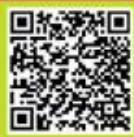
สแกน อ่านบทความฉบับเต็ม