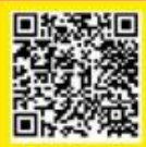
สแกน แนวทางการขออนุญาต ไปต่างประเทศ