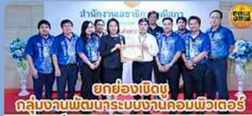
ยกย่องเชิดชู กลุ่มงานพัฒนาระบบงานคอมพิวเตอร์