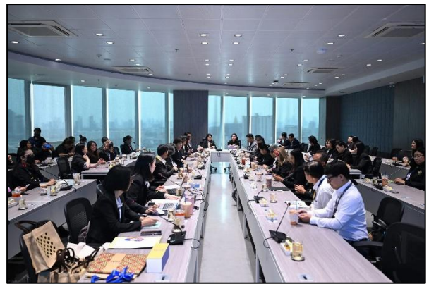
บรรยากาศการแลกเปลี่ยนเรียนรู้ ณ ห้องประชุม ๔ ชั้น ๑๕ อาคาร ๕๐ ปี กฟผ.