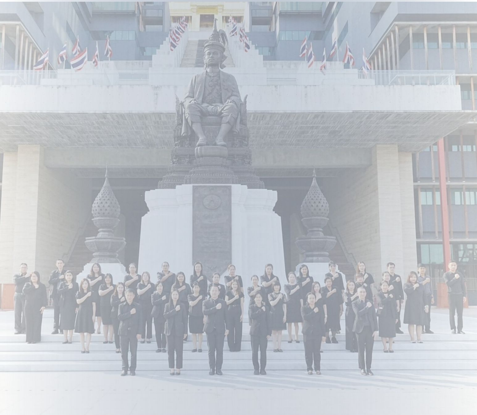
คณะทำงานขับเคลื่อนองค์กร STRONG จิตพอเพียงด้านทุจริต ส่งเสริมคุณธรรม และความโปร่งใสของสำนักงานการประชุม ประจำปีงบประมาณ พ.ศ. 2569