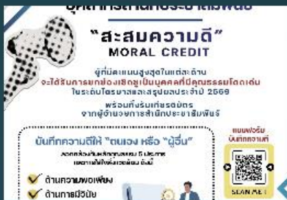
และป้องกัน ม.พ.ศ.