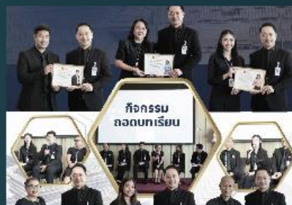
สำนักประชาสัมพันธ์ (สว.) ขอเผยแพร่รายงานสรุปกิจกรรมการคัดเลือก