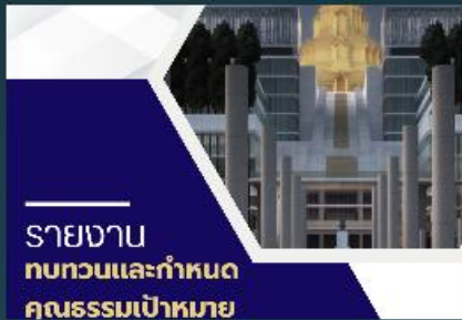
รายงานทบทวนและกำหนดคุณธรรมเป้าหมายกลุ่มตรวจสอบภายใน (สว.)