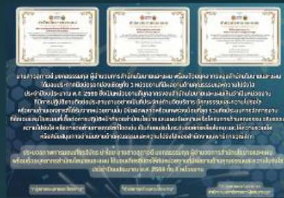
สำนักนโยบายและแผน (สว.) ร่วมมอบเกียรติบัตรให้กับหน่วยงานที่มีผลงานดี