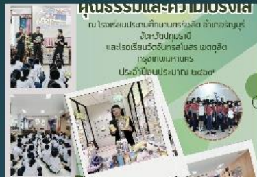
ร่งใสและป้องกัน ะมาณ พ.ศ.