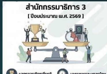
สำนักกรรมการ 3 (สว.) ขอ ประชาสัมพันธ์ รายงานการส่งเสริม