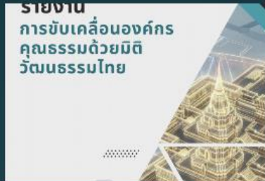
รายงานการขับเคลื่อนองค์กรคุณธรรม ด้วยมิติวัฒนธรรมไทย กลุ่มตรวจสอบ