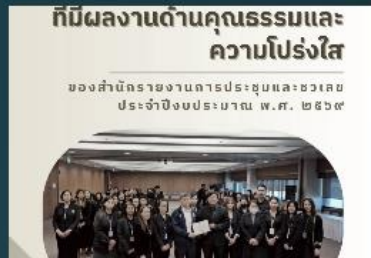
สำนักรายงานการประชุมและตัวเลข (สว.) ขอเผยแพร่การดำเนินงานตามแผนบูรณ