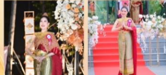
คณะทำงานขับเคลื่อนองค์กร เยี่ยมฯ จิตพอเพียง. ตามทงจิต. สังเสในคณธรรณและควมไปรงใส. สำนักกรรมาธิการ 3