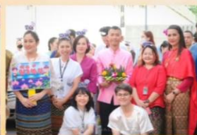
คณะกรรมการขับเคลื่อนองค์กร 3 ร่วม กิจกรรมจิตพอเพียง ด้านคุณธรรมและคุณธรรมใจใส สัปดาห์กรรมการ 3