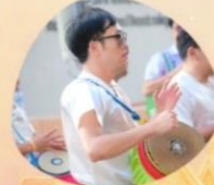
คณะกรรมการขับเคลื่อนองค์กร 3 ร่วม กิจกรรมจิตพอเพียง ด้านคุณธรรมและคุณธรรมใจใส สัปดาห์กรรมการ 3