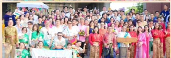
คณะกรรมการขับเคลื่อนองค์กร 3 ร่วม กิจกรรมจิตพอเพียง ด้านคุณธรรมและคุณธรรมใจใส สัปดาห์กรรมการ 3