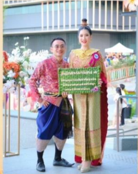
คณะทำงานขับเคลื่อนองค์กร เยี่ยมฯ จิตพอเพียง. ตามทงจิต. สังเสในคณธรรณและควมไปรงใส. สำนักกรรมาธิการ 3