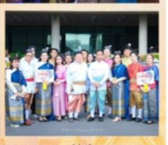
คณะกรรมการขับเคลื่อนองค์กร 3 ร่วม กิจกรรมจิตพอเพียง ด้านคุณธรรมและคุณธรรมใจใส สัปดาห์กรรมการ 3