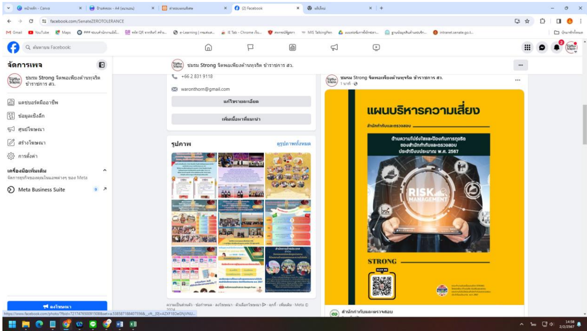
ประชาสัมพันธ์ผ่านช่องทาง Facebook ชมรม STRONG จิตพอเพียงต้านทุจริต ข้าราชการ สว.