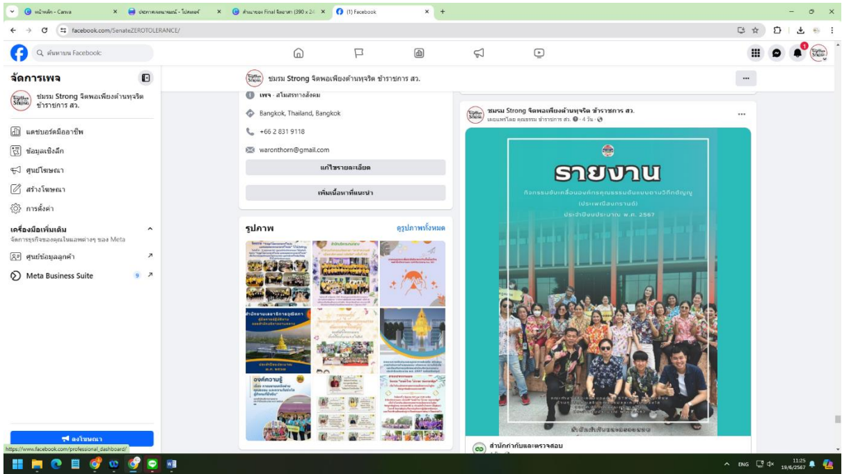
ประชาสัมพันธ์ผ่านช่องทาง Facebook ชมรม STRONG จิตพอเพียงต้านทุจริต ข้าราชการ สว.