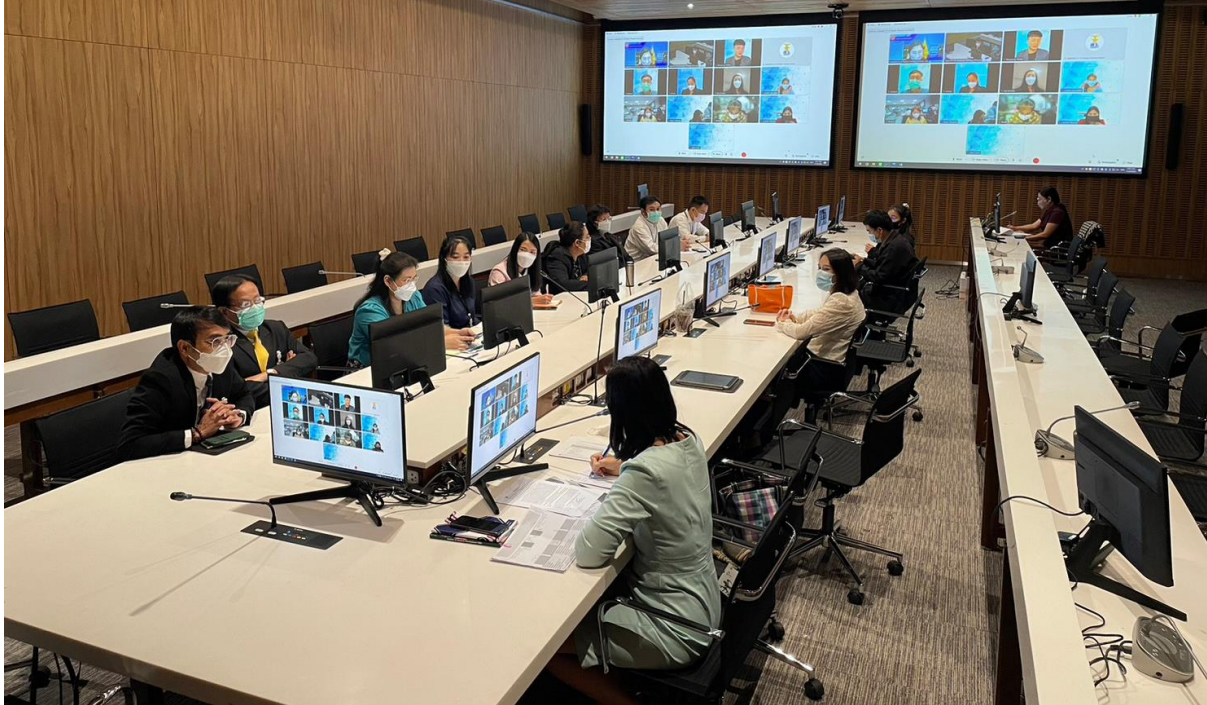
๒.๑ การวิเคราะห์ความเสี่ยงและแนวทางในการป้องกันความเสี่ยงที่อาจเป็นเหตุให้ละเว้นการปฏิบัติหน้าที่โดยมิชอบ มิติการบริหารบุคคล