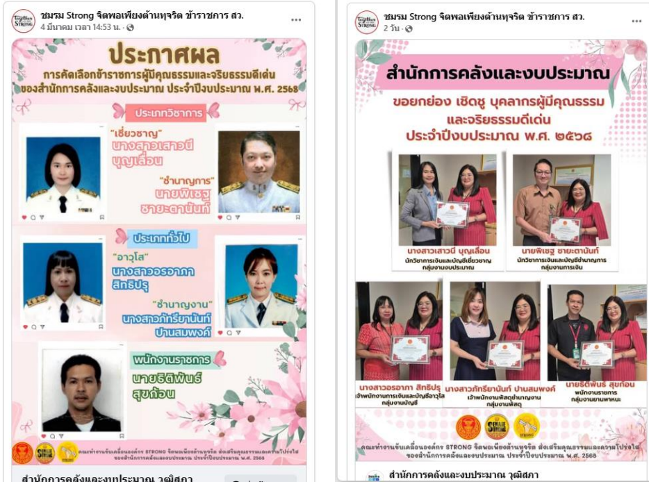
สำนักการคลังและงบประมาณ วุฒิสภา