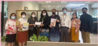
วันพฤหัสบดีที่ ๘ มิถุนายน ๒๕๖๖ เวลา ๑๓.๓๐ นาฬิกา