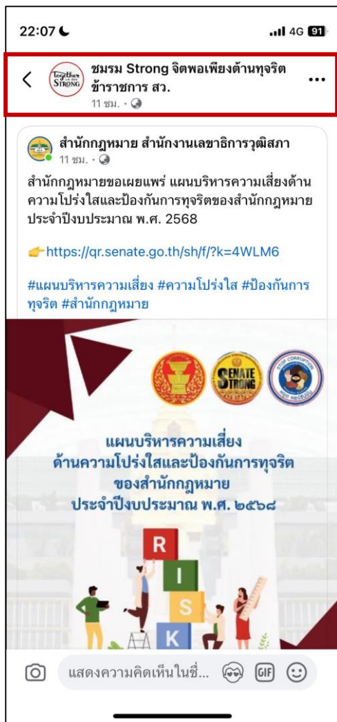
๓.๑ เฟซบุ๊กชมรม Strong จิตพอเพียงต้านทุจริต